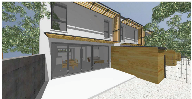
© Architecte : Atelier d'architectures Le Moellon Vert

Ce programme sera construit sous forme de maisons groupées, afin de s'intégrer au quartier résidentiel et d'accroître les performances thermiques.