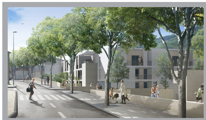
© Architectes : M. Daniel FANZUTTI

D'un point de vue architectural, les trois bâtiments du collectif sont organisés