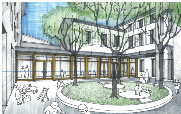
© Architecte : Peysson / Vettorello

Ces locaux ont été aménagés par DAH dans le cadre d'un mandat assuré pour le compte de la Communauté de Communes du Diois et de la Ville de Die.